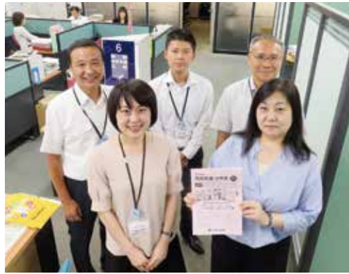
業務課が担当しています。お気軽にお問合わせください。

他にも、災害・病氣入院が1日以上で給付されるなど制度が充実したこの機会に、是非加入・増口をご検討いただければと思います。